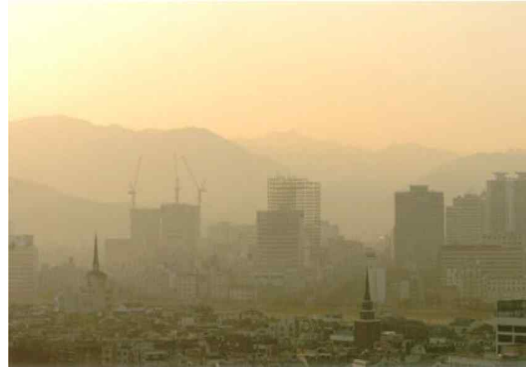
< 서울을 덮은 황사 >

미세먼지는 발생원인과 상관없이 입자크기가 10\mu\text{m} ( 1\mu\text{m} 는 1/1,000\text{mm} 이다) 이하인 먼지를 통칭하는 용어입니다.