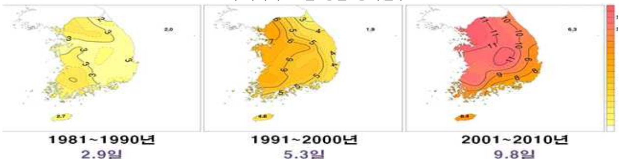
<우리나라 10년 평균 황사일수>

최근 10년간('07~'16) 총 23회 52일 발생했으며 3~5월 집중발생(17회 42일, 80%)합니다. 연간 황사 발생 일수는 2.9일(80년대), 5.3일(90년대), 9.8일(00년대)로 증가하는 추세이며 최근 가을과 겨울에도 발생하는 경우도 있습니다.