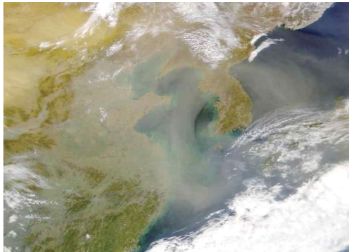
< 서해와 동해를 덮은 황사 >

주로 3~5월 발생하는 황사는 바람에 의하여 하늘 높이 불어 올라간 미세한 모래먼지가 대기 중에 퍼져서 하늘을 덮었다가 서서히 떨어지는 현상 또는 떨어지는 모래흙을 말합니다.