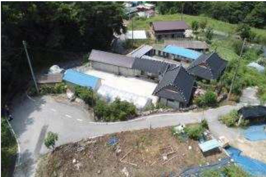
원호덕 틈새정원 조성