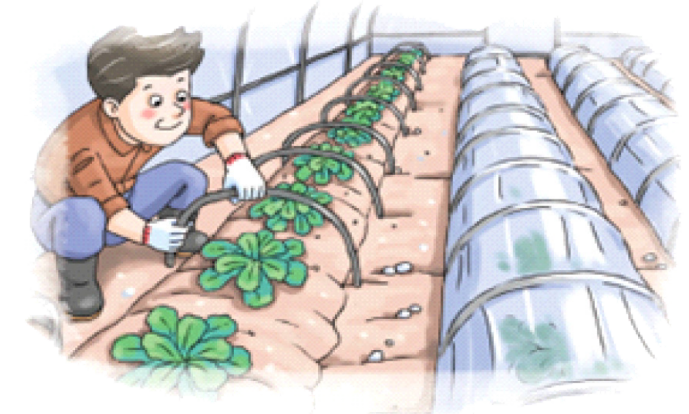
◦ 시설파손, 저온피해 우려시 소형터널 설치