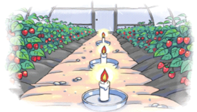
◦ 정전, 온풍기 고장시 양초·알코올 등 응급조치

※ 응급대책 활용시 화재 위험성 및 산소부족으로 불이 꺼질 수 있으므로 세심한 관리 필요