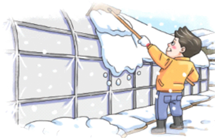
◦ 하우스 위 눈 쓸어내기