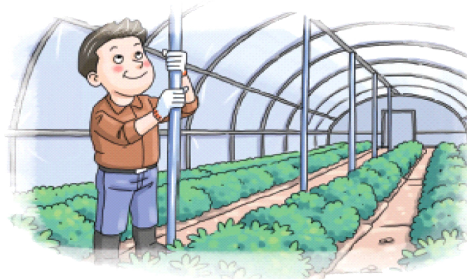
◦ 노후화된 시설 등은 보강지주 설치