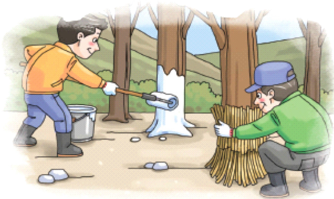
◦ 과수 주간부 벗짚피복 또는 수성페인트 칠하기