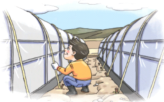
◦ 시설하우스 고정끈 설치 및 보강