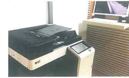
PC및 프린터 복합기