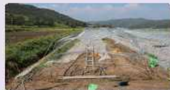
[일반 피해 하우스]