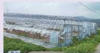
[비닐 사전 제거 하우스]