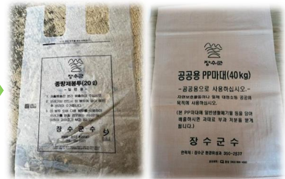
소각용 쓰레기 봉투, 매립용 마대