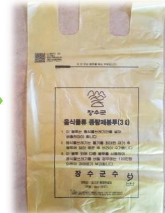
음식물 쓰레기 봉투