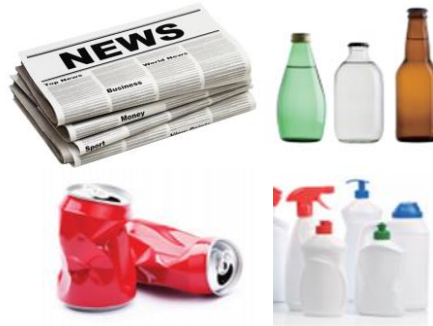
종이류, 빈병, 캔, 고철, 플라스틱 등