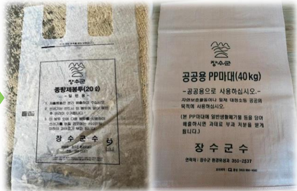
매립용 쓰레기 봉투, 마대

(과일 씨앗, 조개껍데기, 생선 뼈, 닭 등 짐승 뼈, 티백, 한약재 등)