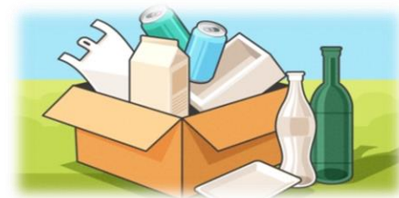
종류별로 묶거나 투명봉투에 담아 배출