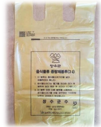
음식물 쓰레기 봉투