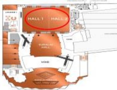
True Icon Hall 위치