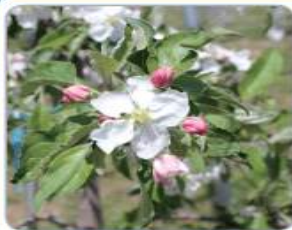
(2차)개화10~20%, (3차)2차 살포 후 5~7일 후