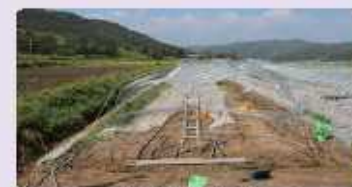
[일반 피해 하우스]