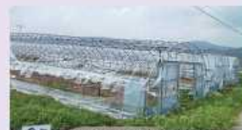
[비닐 사전 제거 하우스]