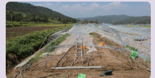
[일반 피해 하우스]