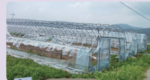
[비닐 사전 제거 하우스]