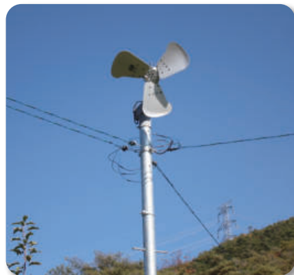
〈방상팬 이용 송풍〉